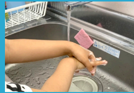
講師・生徒の 手洗い徹底