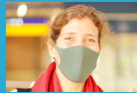
全社員・生徒の マスク着用