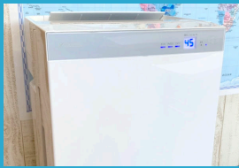
すべての教室に 空気清浄機を設置