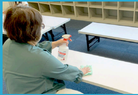
机、ドアノブなど 除菌液での定期消毒