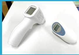
生徒入室前の 検温の実施