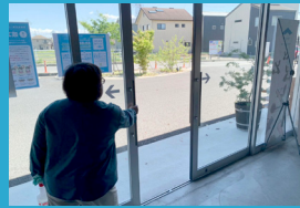
定期的に 換気を実施