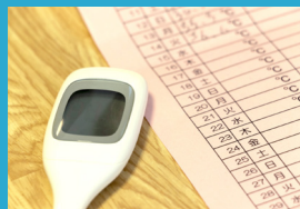
従業員・同居家族に発熱などの 症状がみられた場合の 出社制限

また、オンラインサポート、様子伺いのお電話など、できる限りのことをさせていただいております。