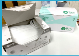
生徒用マスクの 完備